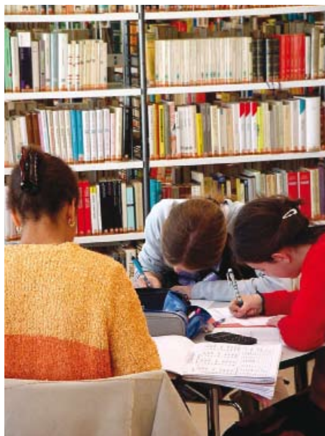
Oggi gli studi tecnici e scientifici rappresentano indirizzi strategici per l'inserimento nel mondo del lavoro.

Le imprese continueranno ad avere bisogno prima di tutto della vera "materia prima" senza la quale non si possono vincere le sfide del mercato: risorse umane preparate. Giovani capaci di prendere il proprio posto nel mondo di domani.