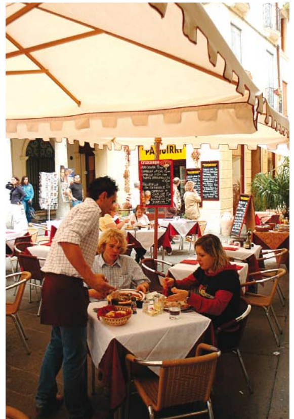
Per i giovani è fondamentale individuare le nuove offerte professionali che possono colmare le lacune del mercato.

Infine e anche per sdrammatizzare, dovrà considerare che un pizzico di fortuna, sempre indispensabile, può aiutare anche a risolvere situazioni per altri versi difficili o addirittura proibitive.