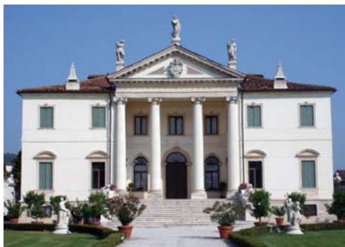
Villa Cordellina Lombardi - Vicenza

Più contenuto, seppur sempre su livelli elevati, è risultato invece il numero degli inserimenti in lista di mobilità, rispetto ai quali rimane consistente soprattutto il numero di quelli riferiti ai licenziamenti individuali effettuati da aziende di piccole dimensioni.