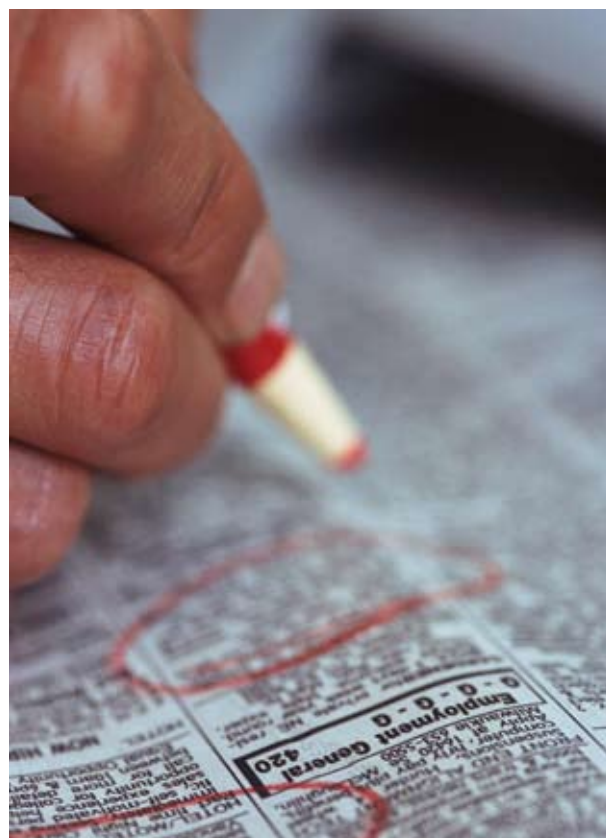
La conoscenza delle lingue straniere e un’esperienza in azienda o all’estero sono una aiuto nel momento in cui si cerca un lavoro.

Tornando ad oggi, dal punto di vista contrattuale l’ingresso nel mondo del lavoro nel settore terziario passa spesso attraverso un contratto di apprendistato. Ricordiamo che il CCNL Terziario fu tra i primi contratti nazionali a prevedere l’istituto dell’“apprendistato professionalizzante”: una volta concluso il percorso formativo e raggiunta, quindi, la piena professionalità, il lavoratore può ancora contare su buone opportunità occupazionali nel settore, visto che, anche in una fase di stallo dell’economia, il comparto ha comunque fatto registrare una tenuta nel numero degli addetti.